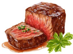
● เนื้อวัว

ขอความกรุณาแจ้งวัตถุประสงค์ที่ท่าน แพ้หรือไม่สามารถรับประทานได้