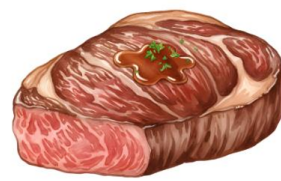
● เนื้อหมู