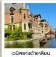
เวนิสแห่งต้าเหลียน