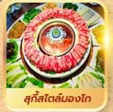
สุกีสโตลมองโก