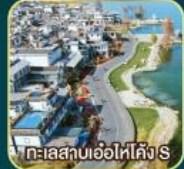
ทะเลสาบเอ๋อไห่คัง S