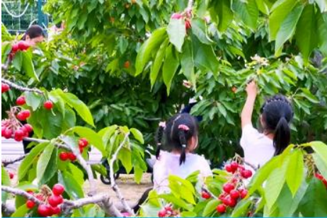
สวนเชอร์รี่

รับประทานอาหารเช้า ณ ห้องอาหารของโรงแรม (10)