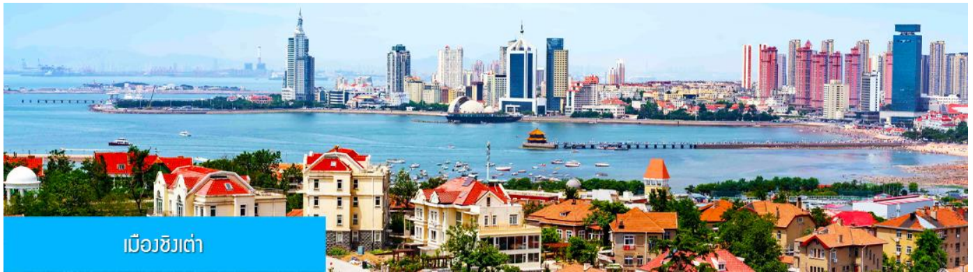
เมืองชิงเต่า