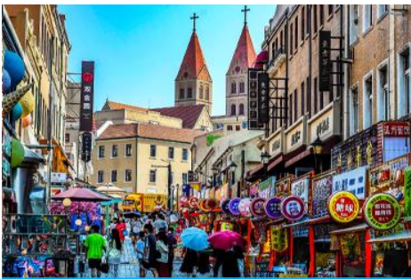
ถนนจงซาน

หลังอาหารนำท่านเดินทางชม สะพานจ้านเจียว 栈桥 เป็นแลนด์มาร์กแห่งประวัติศาสตร์คู่เมืองชิงเต่า สร้างเมื่อปี ค.ศ.1891 มีลักษณะเป็นสะพานหินทอดยาวกว่า 440 เมตรสู่ทะเล ปลายสะพานมีศาลา ทรงแปดเหลี่ยมสีแดงที่โดดเด่น ซึ่งเป็นสัญลักษณ์บนฉลากเบียร์ชิงเต่า ขึ้นชื่อเรื่องวิวสวย รับลมทะเล ให้ท่านเก็บภาพบรรยากาศ