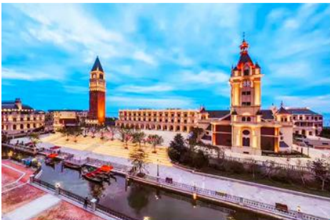
เมืองเวนิสตะวันออก