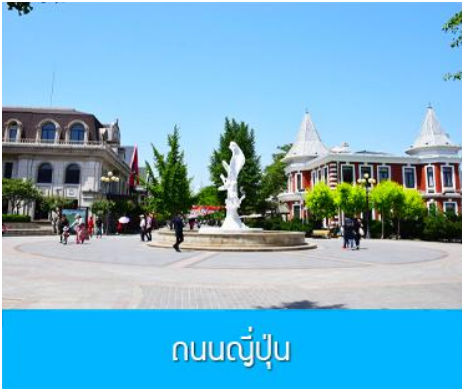
ถนนญี่ปุ่น