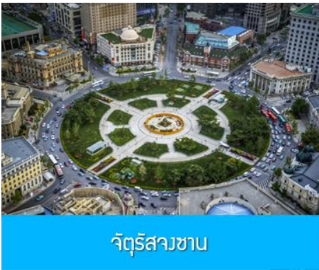
จัตุรัสวงเวียน