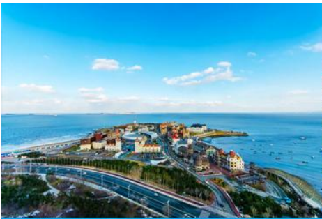
ท่าเรือชาวประมงไห่ซาง