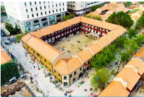
เมืองเก่าเยอรมัน ตรอกกว้างชิงหลี่

จากนั้นนำท่านเดินเที่ยวชม ถนนจงซาน 中山路 ถนนที่เต็มไปด้วยกลิ่นอายยุโรป และถนนสายนี้มีบันทึกรื่องราวมากกว่าศตวรรษของเมืองชิงเต่าไว้ ที่นี่เป็นศูนย์กลางการค้าแห่งแรกที่เต็มไปด้วยสถาปัตยกรรมสไตล์ยุโรปเก่าแก่ที่ได้รับอิทธิพลมาจากเยอรมัน ให้ท่านได้เดินเก็บบรรยากาศ และ เก็บภาพกับ โบสถ์เซนต์ไมเคิล (ด้านนอก) โบสถ์แห่งนี้ที่คู่รักนิยมมาถ่ายภาพงานแต่งงานกันมากที่สุดในเมืองชิงเต่า ให้ท่านถ่ายรูปเก็บภาพ