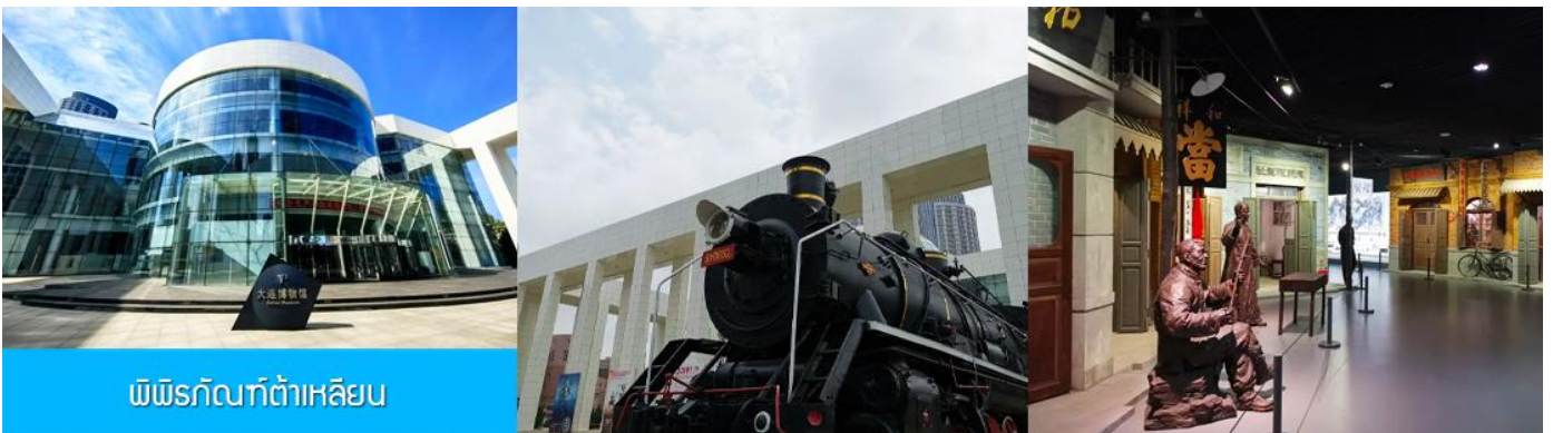
พิพิธภัณฑ์ต้าเหลียน

เช้า รับประทานอาหารเช้า ณ ห้องอาหารของโรงแรม (13)