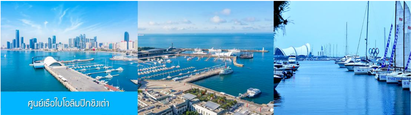
ศูนย์เรือใบโอลิมปิกชิงเต่า

จากนั้นนำท่านเที่ยวชม โรงเบียร์ชิงเต่า 青岛啤酒博物馆 พิพิธภัณฑ์เบียร์ที่ขึ้นชื่อของเมืองชิงเต่า ซึ่งเป็นเบียร์ยี่ห้อแรกที่ผลิตขึ้นในประเทศจีน ชมเบียร์ คอลเลกชันที่มียี่ห้อหลากหลายที่สุดของโลก และชมการจัดแสดงภาพและวิดิทัศน์เกี่ยวกับวิวัฒนาการของเบียร์ ขั้นตอนการผลิตและอื่น ๆ ที่เกี่ยวข้อง พร้อมชิมเบียร์ชิงเต่า ซึ่งเป็นเบียร์ที่ขายดีที่สุดในยี่ห้อหนึ่งของจีน.. (ชิมเบียร์ชิงเต่าท่านละ 1 แก้ว รับกลับอีก 1 ขวดเล็ก ตอนเดินออก)