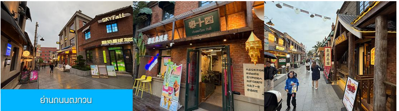
ย่านถนนตงกวน

นำท่านเที่ยวชม จัตุรัสชิงไห่ 星海广场 เป็นจัตุรัสขนาดใหญ่เป็นแลนด์มาร์คสำคัญของเมืองต้าเหลียน สร้างขึ้นเพื่อเฉลิมฉลองในโอกาสที่รัฐบาลอังกฤษคืนเกาะฮ่องกงในให้จีนในปี ค.ศ. 1997 ตั้งอยู่ชายฝั่งทะเลในเมืองต้าเหลียน เป็นจัตุรัสใจกลางเมืองที่ใหญ่ที่สุดในโลกและเป็นแลนด์มาร์คของเมืองต้าเหลียน รายล้อมด้วยตึกระฟ้าที่ทันสมัย ภายในมีบ่อน้ำพุดนตรี ลานหญ้าขนาดใหญ่ และลานกว้างสำหรับจัดกิจกรรมกลางแจ้ง อาทิ เทศกาลเปียร์นานาชาติ การแข่งขันวิ่งมาราธอน งานแฟชั่นนานาชาติเมืองต้าเหลียน ฯลฯ