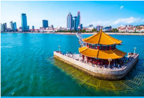
สะพานจ้านเจียว