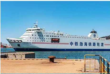
เรือ ZHONGTIE BOHAI CRUISE