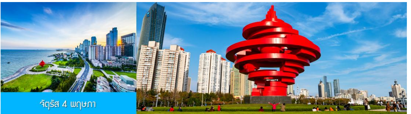
จัตุรัส 4 พฤษภาคม

จากนั้นนำท่านเที่ยวชม ศูนย์เรือใบโอลิมปิกชิงเต่า (Qingdao Olympic Sailing Center) ซึ่งเป็นสถานที่จัดการแข่งขันเรือใบในโอลิมปิกฤดูร้อน 2008 ปัจจุบันเป็นสถานที่ท่องเที่ยวชั้นนำริมทะเลที่สวยงาม มีท่าจอดเรือยอร์ชท์, พื้นที่จัดกิจกรรม, และทิวทัศน์ที่สวยงาม ให้นำท่านเก็บภาพบรรยากาศความสวยงามตามอัธยาศัย