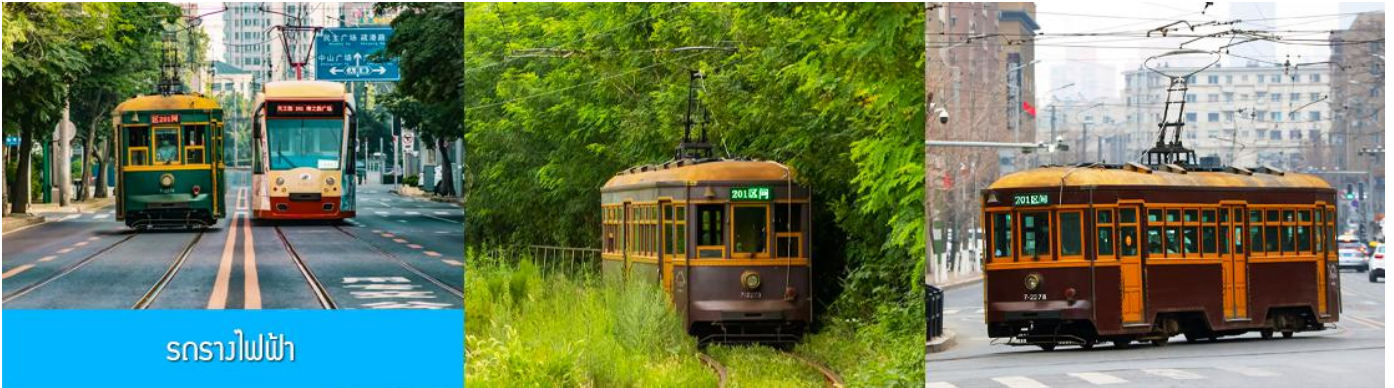
รถรางไฟฟ้า