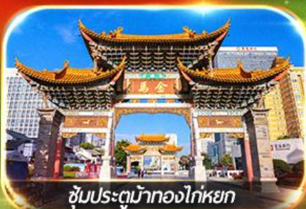
ซุ้มประตูม้าทองไก่อหยก