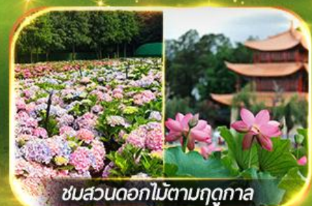
ชมสวนดอกไม้ตามฤดูกาล

นั่งกระเช้ากุเขาสหะเจี้ยวจื่อ ชมน้ำตกสุดอลังการสวนน้ำตกคุนหมิง ซอปปิงถนนคนเดินหนานผิงเจี๋ย, ชมดอกไม้ตามฤดูกาล