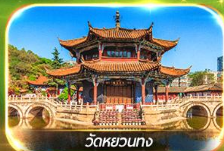
วัดหยวนทาง