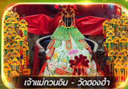
เจ้าแม่กวนอิม - วัดย่องฮำ