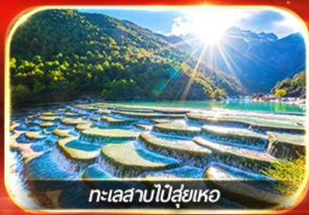
ทะเลสาบโป๋ส่วยเหอ