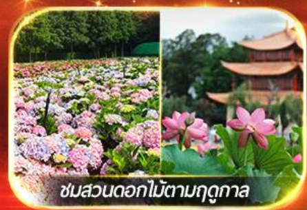
ชมสวนดอกไม้ตามฤดูทงกา

นั่งกระเช้าสู่ภูเขาหิมะมังกรหยก ชมโชว์ทิเบต "Impression Lijiang" สุดอลัง เช็กอินคาเฟ่วิวภูเขาหิมะ, ชมดอกไม้ตามฤดูทงกา