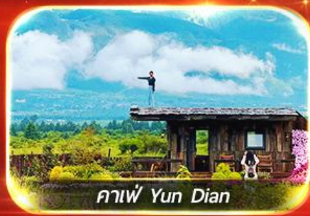
กาแฟ Yun Dian