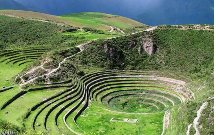
บ่าย นำท่านเดินทางสู่ มาราซ (Maras) แหล่งผลิตเกลือที่คุณภาพดีที่สุดในโลก ที่มีมาตั้งแต่สมัยอินคา แนวนาขั้นบันไดที่เรียงอยู่ตามลำดับความสูงของภูเขา จากนั้นเดินทางสู่ โมเรย์ (Moray) นาขั้นบันไดวงกลมขนาดใหญ่หลายรูปร่างแปลกตาที่ชาวอินคาทำไว้เพื่อทดลองปลูกพืชพันธุ์ต่างๆ จากจุดนี้สามารถมองเห็น หมู่บ้านอุрубัมบา (Urubamba) ได้อีกด้วย ได้เวลาเดินทางกลับสู่เมือง เมืองคัสโก (Cusco) เมืองหลวงของอาณาจักรอินคา ที่แพร่ขยายอำนาจจนกินพื้นที่ 1 ใน 3 ของอเมริกาใต้ ตั้งอยู่เหนือระดับน้ำทะเลถึง 3,400 เมตร และเป็นแหล่งอารยธรรมยุคก่อนประวัติศาสตร์ที่ลึกลับน่าทึ่ง เป็นชุมชนเก่าแก่ของจักรวรรดิอินคาอันรุ่งเรือง ซึ่งยังคงทิ้งร่องรอยความเจริญไว้ให้เห็นเป็นซากปรักหักพังโบราณและโบราณวัตถุต่างๆ