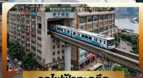
รถไฟฟ้าทะลุติ๊ก