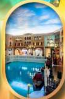
เดอะเวนิเซียน