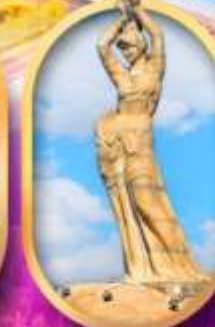
เด็กหญิงชาวประมง