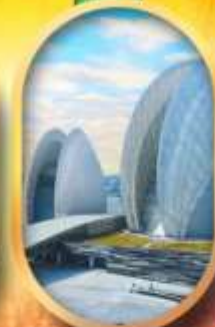
โรงละครไข่มุก