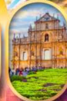
โบสถ์เซนต์พอล