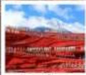
ไร่ชางอีหมว