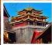
วัดกาม-ซงจ้านหลิง