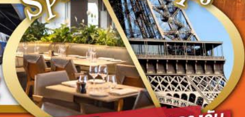
รับประทานอาหารกลางวัน บนหอคอไอเฟล