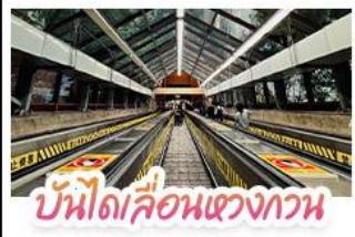
บันไดเลื่อนแขวงกวน