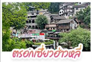
ตรอกเซียวฮ่าวเฉี