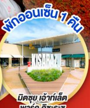
มิตซุย เอ้าท์เล็ต พาร์ค คิชะระชู