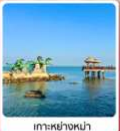
เกาะหย่างหม่า