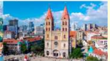
โบสถ์คริสต์เซนต์ไมเคิล

*ทางบริษัทฯ ขอสงวนสิทธิ์ในการสลับโปรแกรมทัวร์ตามความเหมาะสมขึ้นอยู่กับสถานการณ์หน้างาน โดยคำนึงถึงผลประโยชน์ของลูกค้าเป็นสำคัญ