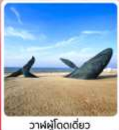
วาฬผู้โดดเดี่ยว