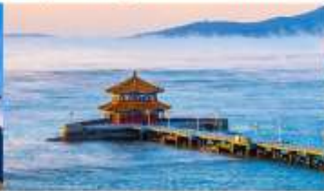
สะพานจันเจียว