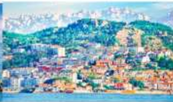
หมู่บ้านชาวประมงซาจื่อโซ่ว