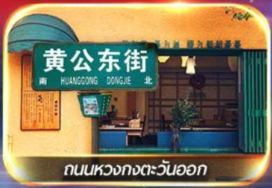
ถนนหลวงกงตะวันออก