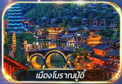
เมืองโบราณปู้

สัมผัสบรรยากาศสุดโรแมนติก ณ หมู่บ้านปู้ & ป่าภูเขาหมื่นยอด เดินเล่น Wenlin Street ชมต้นแปะก๊วย & ถนนสายคาเฟ่สุดฮิต