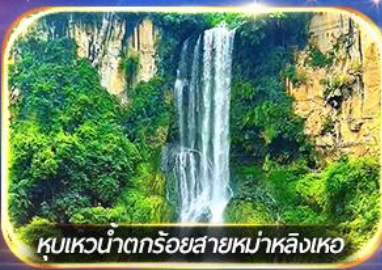
หุบเขาน้ำตกร้อยสายหม่าหลิงเหอ