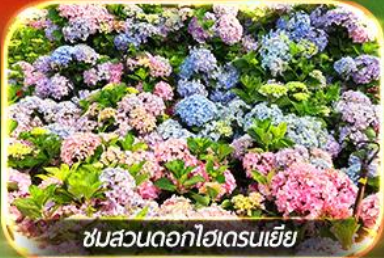
ชมสวนดอกไฮเดรนเยีย