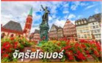
จัตุรัสโรบอร์