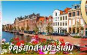
จัตุรัสกลางฮาร์เลม