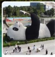
รูปปั้นหมี่แพนด้าเซลฟ์