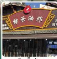
ร้านปังย่าง ของพ่อหวังเหอตี้