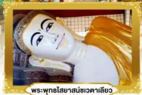
พระพุทธรูปไสยาสน์ชเวตาเลียว