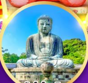
วัดโคโคคุอิน