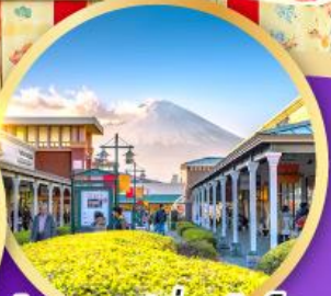
ไทเทมปะ-พรีเมียมเอ้าเล็ค