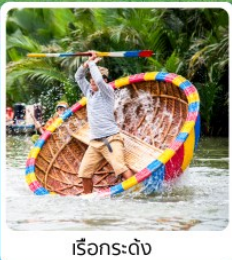
เรือกระดง