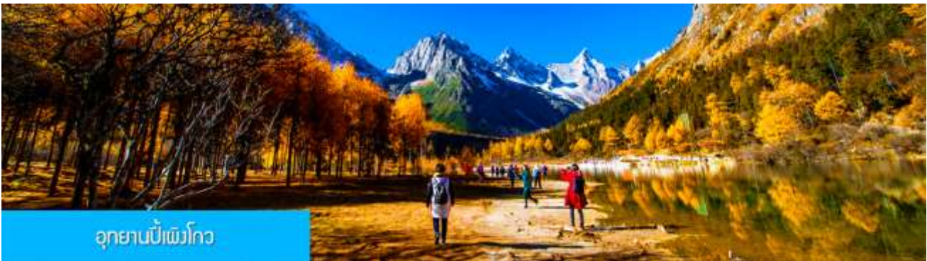
อุทยานปีเหมิงโกว