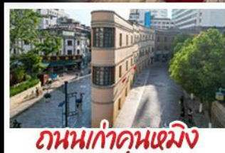
ถนนเก่าคุณหมิง