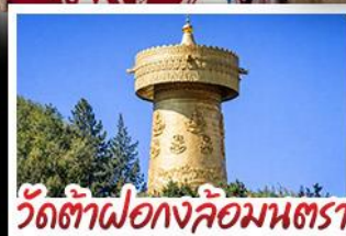
วัดต้าฝอ กงล้อมุนตรา