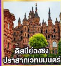
ตึสมยี่ยงฉิง ปราสาทเวทมนตร์