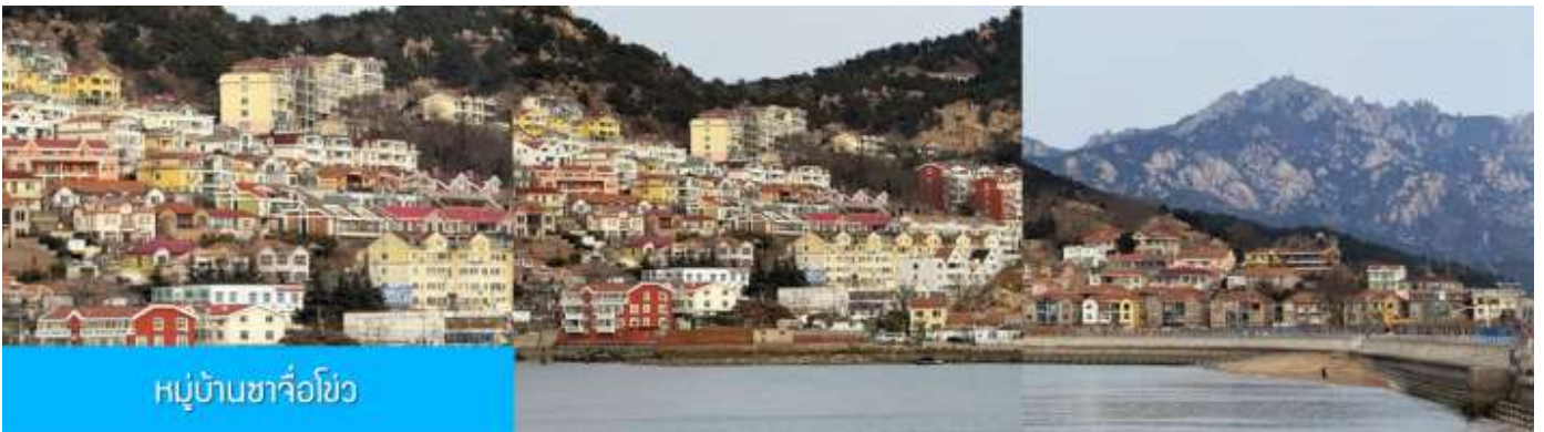
หมู่บ้านซาจื่อโขว

เที่ยง รับประทานอาหารกลางวัน ณ ภัตตาคาร (มื้อที่ 7)