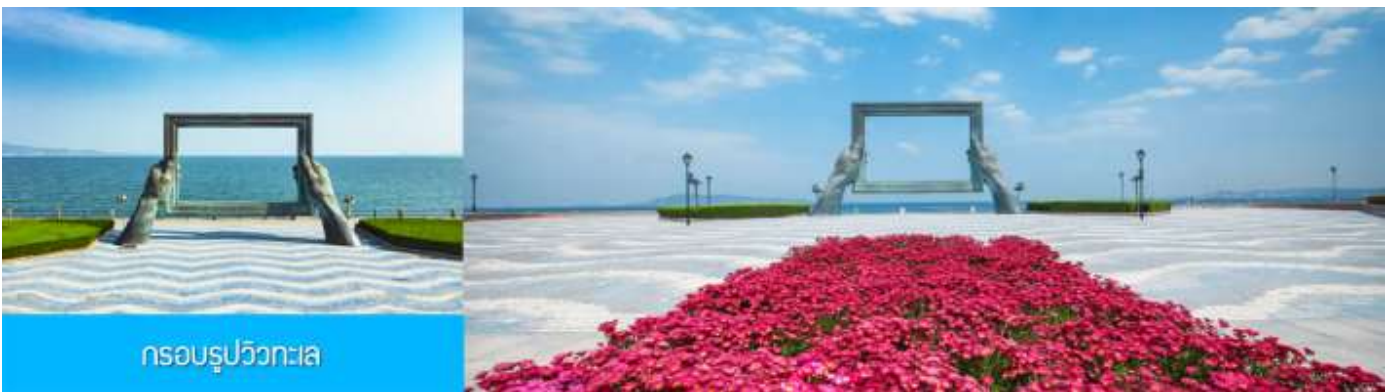
กรอบรูปวิวทะเล

พักที่ Holiday Inn Express Hotel หรือ ระดับมาตรฐาน 4 ดาว ท้องถิ่น