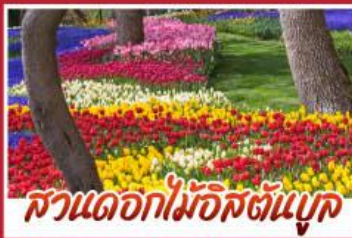
สวนดอกไม้อิสตันบูล