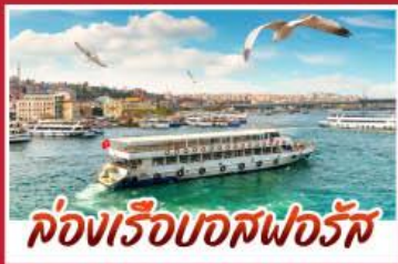
ล่องเรือบอสฟอรัส