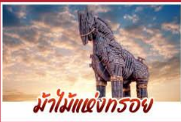
ม้าไม้แห่งกรอย