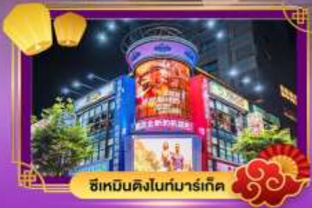
ซีเหมินดิงไนท์มาร์เก็ต