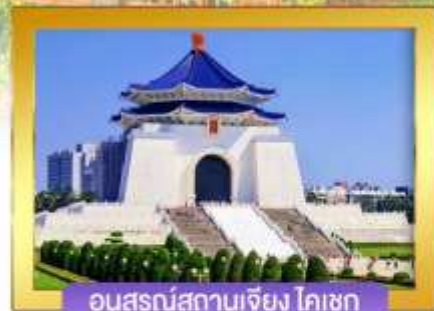
อนุสรณ์สถานเจียง ไคเชก