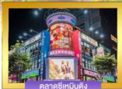
ตลาดซีเหมินติง