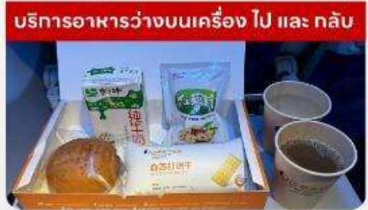
บริการอาหารว่างบนเครื่อง ไป และ กลับ