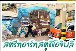
สตรีทอาร์ต สตูดิโอจิบลิ