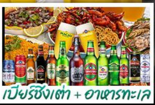
เบียร์ชิงเต่า + อาหารทะเล