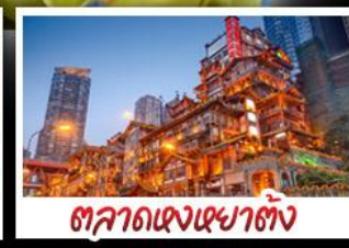
ตลาดแดงเฉาตัง