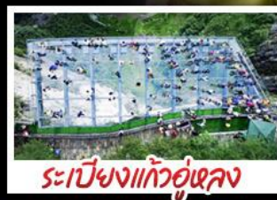
ระเบียงแก้วอุ้งหลง