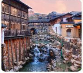
เมืองโบราณเหยahu