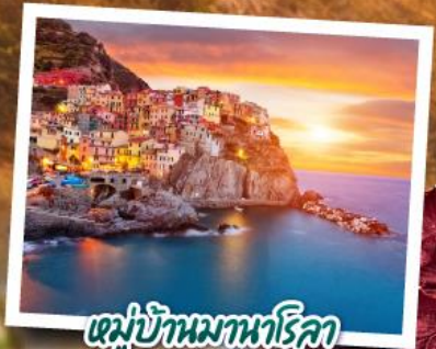
หมู่บ้านมานาโรคา