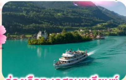
ล่องเรือทะเลสาบเบรียนซ์