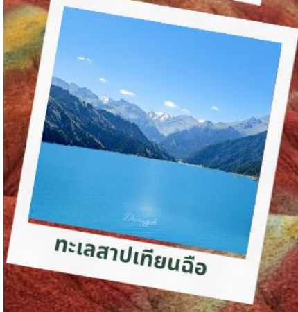
ทะเลสาบเทียนฉือ