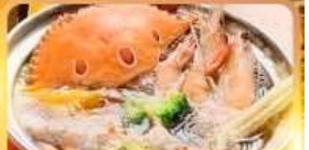
HOT POT SEAFOOD