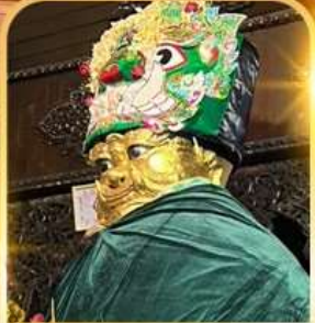
แม่ยักษ์