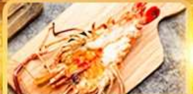
กุ้งแม่น้ำ