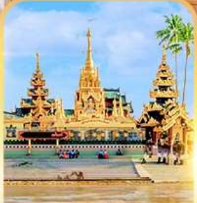
เจดีย์กลางน้ำ (สิเรียม)