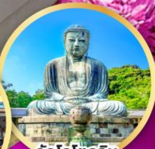
วัดโคโตคุอิน