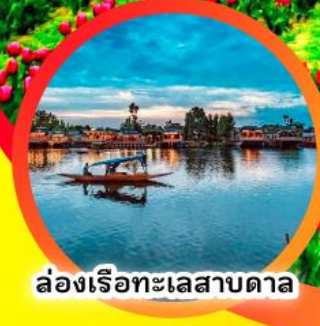
ล่องเรือทะเลสาบดาล