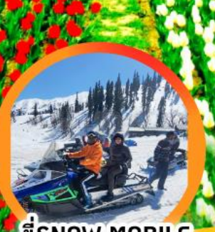
ขี่ SNOW MOBILE