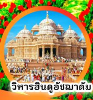
วิหารฮินดูอัชมาดัม