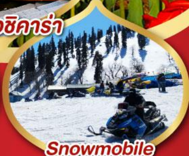
Snowmobile วิวเทากุลมาร์ค ราคาเริ่มต้น