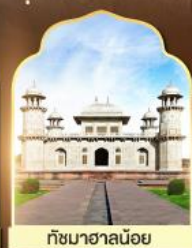
ทัชมาฮาลน้อย