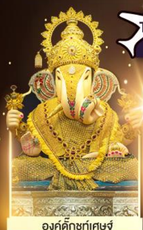
องค์ศักดิ์สิทธิ์