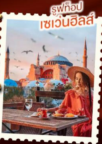
รูปท้อป เซเวนฮิลส์