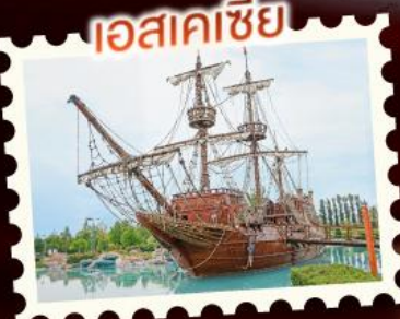
เอสเคเซีย