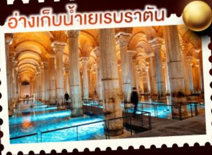
อังกืบน้ำเยเรบราติน