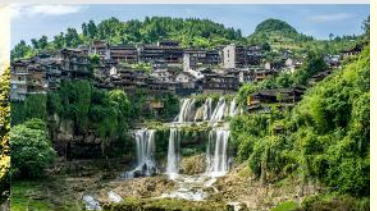
หมู่บ้านโบราณผู่หลงเจิ้น

*ทางบริษัทฯ ขอสงวนสิทธึ้ในการสลับโปรแกรมทัวร์ตามความเหมาะสมขึ้นอยู่กับสถานการณ์หน้างาน โดยค่านึงถึงผลประโยชน์ของลูกค้้าเป็นสำคัญ