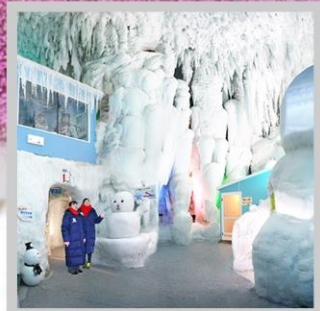
“KAMIKAWA ICE PAVILLION”