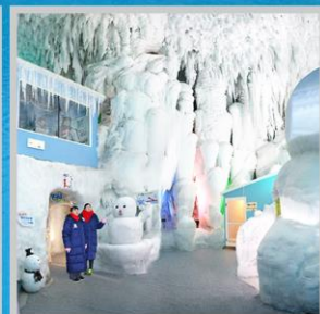
"KAMIKAWA ICE PAVILLION"