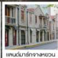
แลนด์มาร์กจางหยวน

เซี่ยงไฮ้ คาลาสสิก ไนท์ / 3 ดึกใหญ่แห่งเซี่ยงไฮ้ ค่องเรือหมู่บ้านโบราณซูโจวเจียว / EKA Tianwu / วัดหลงหัว แลนด์มาร์ก จางหยวน / ถนนหวยไห่ / ชมโชว์ ERA ที่โรงละครโด่งดังระดับโลก / ซินเทียนตี้