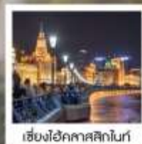
เซี่ยงไฮ้คาลาสสิกไนท์