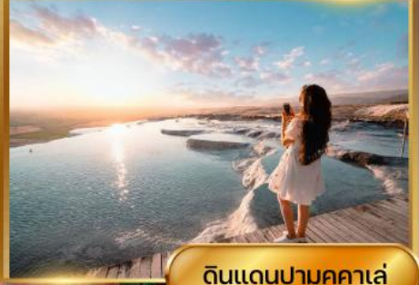
ดินแดนปามุคคาเล่