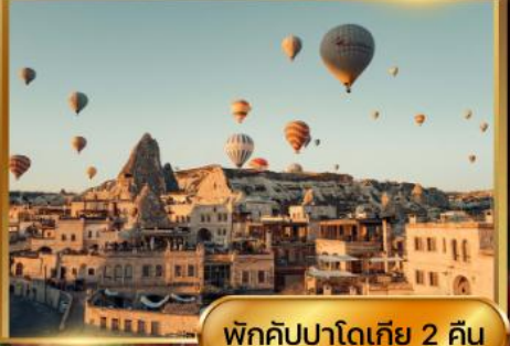
พักคัปปาโดเกีย 2 คืน