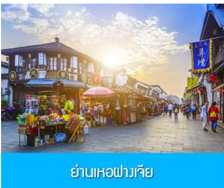
ย่านเหอฝางเจีย

อิสระอาหารมื้อกลางวัน ท่านสามารถเลือกชิม STREET FOOD ขึ้นชื่อมากมายในย่านเหอฝางเจีย