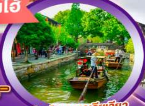
เมืองโบราณซูเจียเจียว