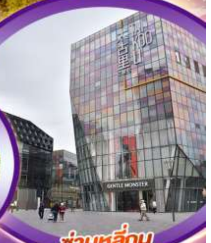
ชานหลี่กุน