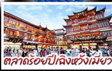
ตลาดร้อยปีเฉิงหวังเมี่ยว