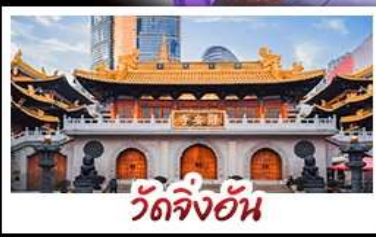
วัดจิ่งอัน