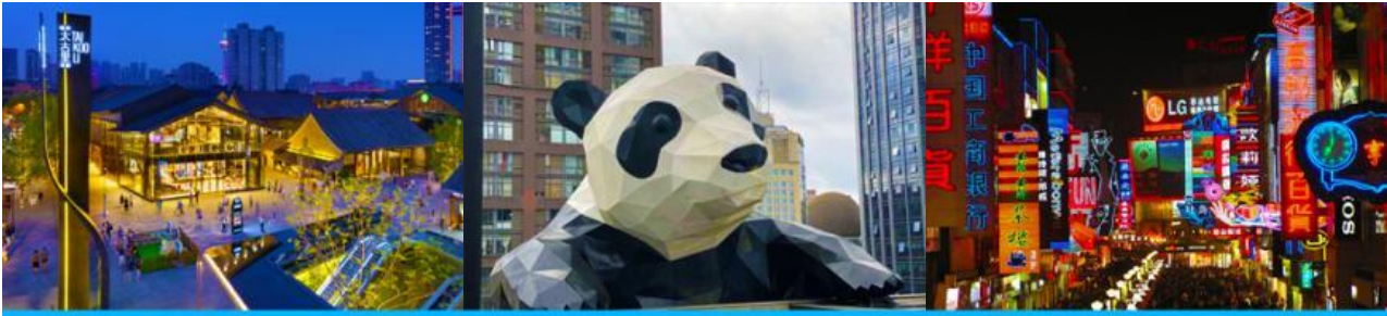
ถนนไท่กุ่หลี่ และวัดต้าจื่อ