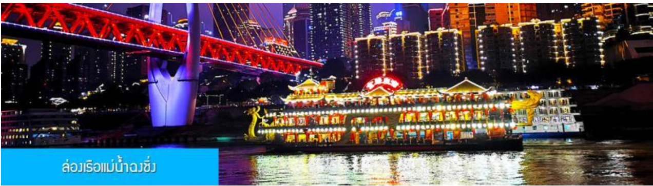
ล่องเรือแม่น้ำวงจี้

OPTIONAL TOUR ไกด์ชายล่องเรือแม่น้ำวงจี้ ชมความสวยงามของสองริมฝั่งแม่น้ำเมืองจ้งจี้ ล่องเรือ ท่านละ 280 หยวน หรือประมาณ 1,400 บาท