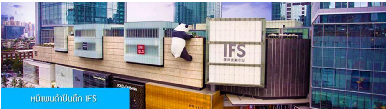
หมีแพนด้าปีนตึก IFS

เที่ยง รับประทานอาหารกลางวัน ณ ภัตตาคาร (14)