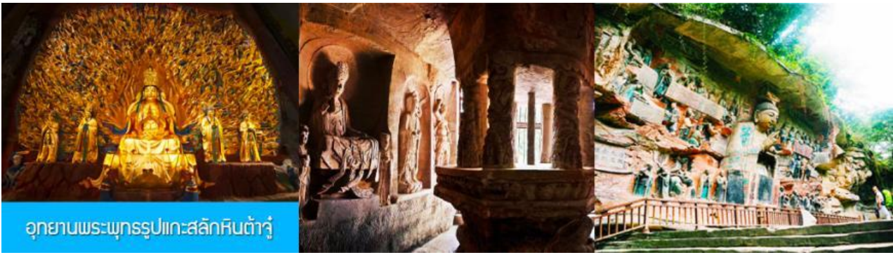
อุทยานพระพุทธรูปแกะสลักหินต้าจู่