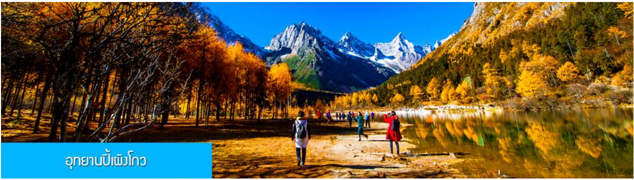
อุทยานปีเพิงโกว