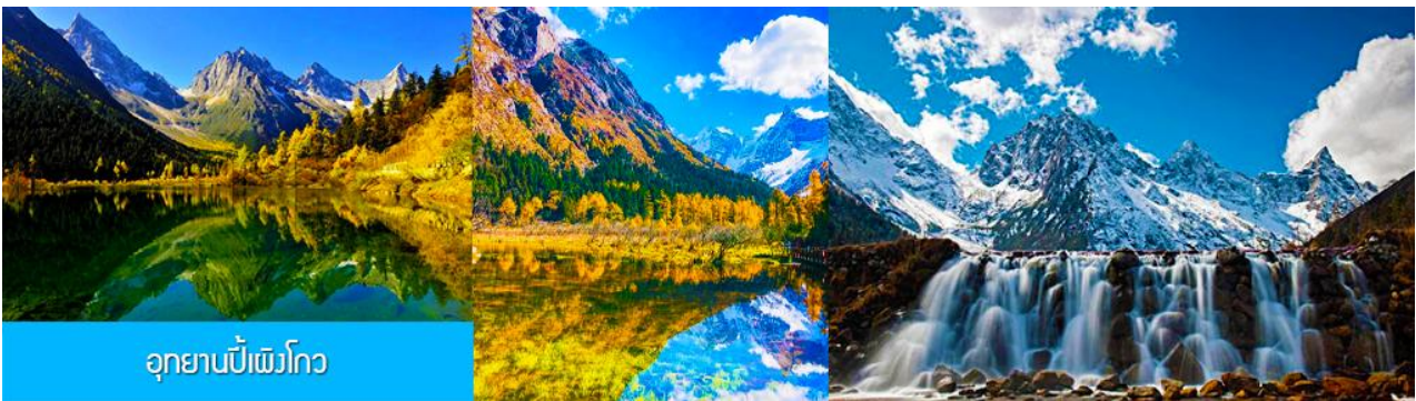
อุทยานปีเพิงโกว