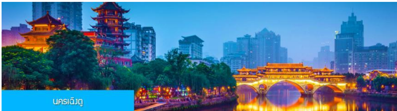
นครเฉิงตู