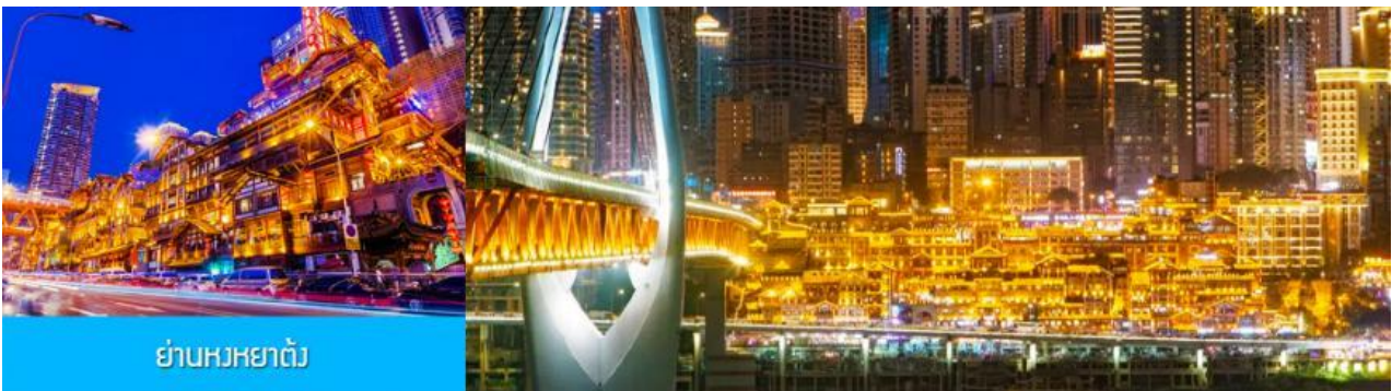
ย่านหงหยาดัง